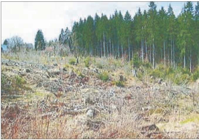
Blöße auf Flst. 500/26