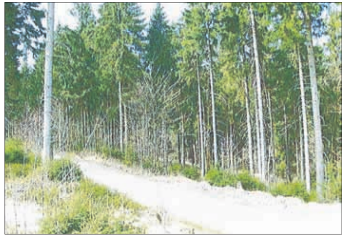
Rennsteig auf Flst. 500/26