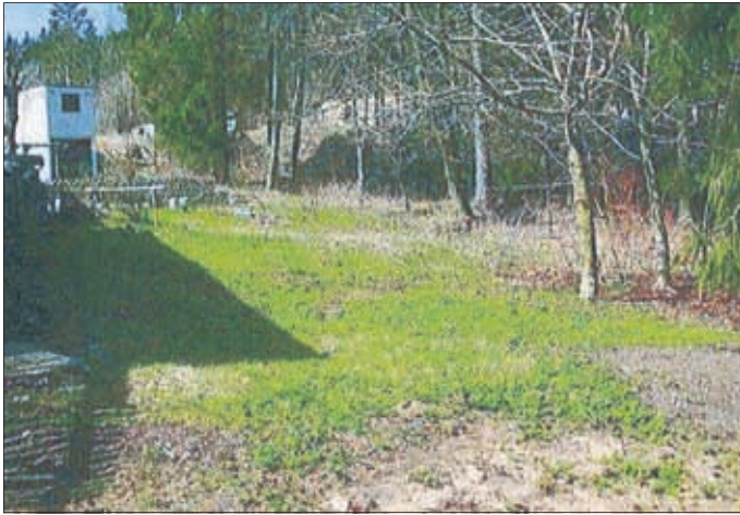
Gartenland auf Flst. 500/4