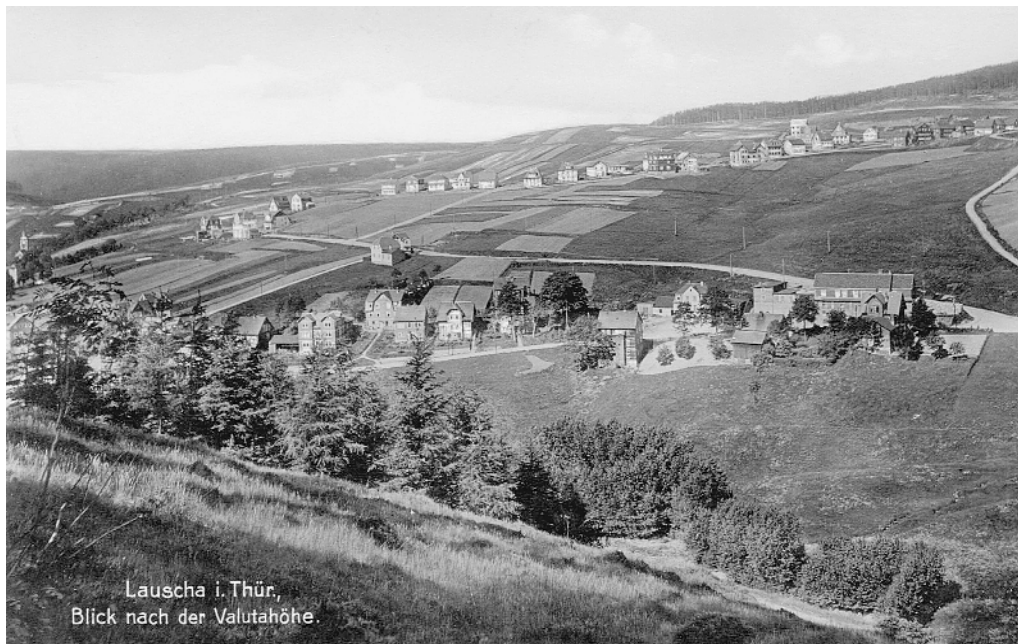
Die „Kupp“ um 1930/1940